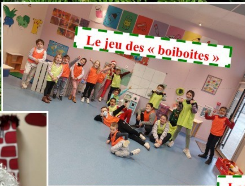
Le jeu des « boiboites »