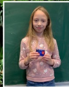
Les petits soldats